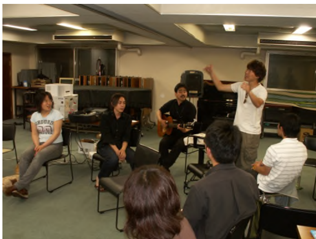
▲祭典でうたう歌はどんな感じ？実際に歌ってみました

会の最後に、正式に青年実行委員会を立ち上げ、「まずは楽しく練習会をするなど、できることから取り組みをはじめ、地域や団体、サークルなどで5分でも10分でも歌いながらひろめていこう!」と確認し合いました♪